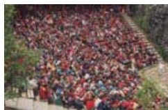
Moster Amfi tar 1.500 tilskuere, og 8 forestillinger pluss ekstraforestilling ble raskt utsolgt